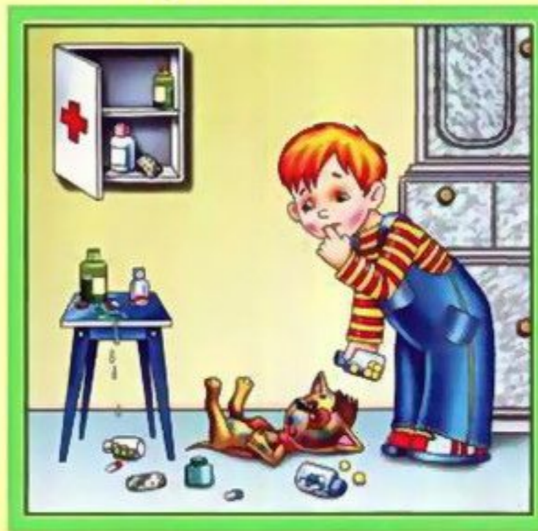
Не трогай таблетки