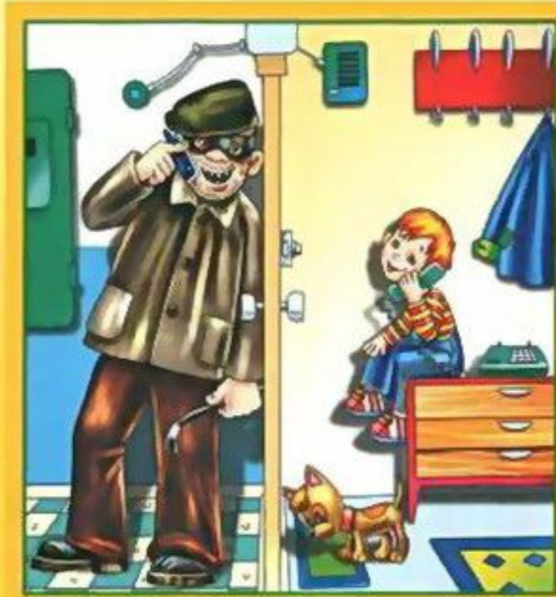
Не разговаривай и не открывай дверь незнакомым людям