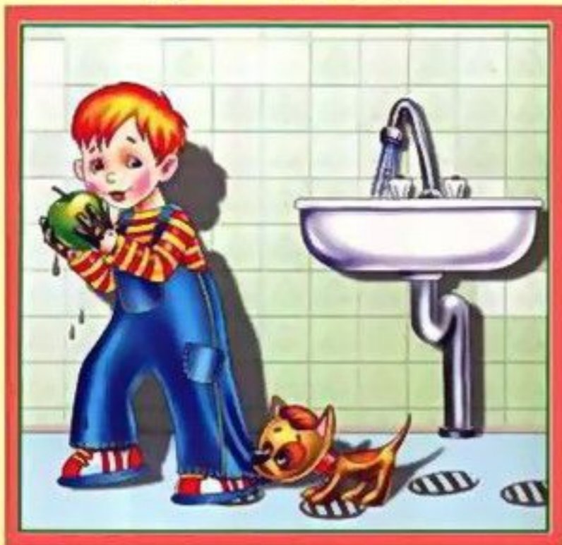
Мойте руки перед едой